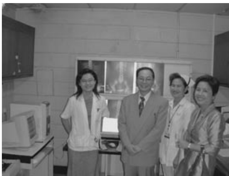
スリナカリン病院の放射線部スタッフと勝田団員

同院において臨床を実施している診療放射線技師の技術レベルが適性であるかは判断できなかったが、基礎的な診療放射線技術は既に修得し、実施しているものと判断できる。しかし、臨床を実施している診療放射線技師の高度な放射線技術の修得と地域の診療放射線技師に対する研修指導方法の修得に関連した援助が必要であると考えられる。