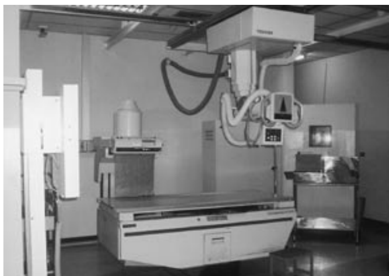
国立コンケーン県総合病院のX線撮影装置

以上より、基礎的な診療放射線技術は既に修得していると考えられるが、今後、成人病患者の増加及び高齢化が予測される状況下においては、高度な最先端機器の導入は不可欠なものであり、診療放射線技師は常に機器の変遷への即応を求められていることから、高度医療機器に対する基礎的診療放射線技術についての研修の必要性は高いものと考えられる。