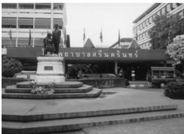
コンケン大学医学部附属スリナカリン病院

タイ東北地方で唯一の大学医学部附属病院である。病床数800床(2006年度400床増設)で2千万人の人口を受け持ち、隣国ラオスからの患者も受け入れている。先端医療機器が整備されており、リハビリテーション施設においては各種機能訓練器具を備えている。伝統医療設備としては、大規模なスチームバスを設置中であり、県総合病院や保健所より遅れが感じられた。