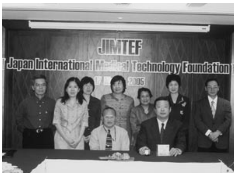
JIMTEF 診療放射線技術コース修了研修員合同会議 タイ国放射線技師会首脳と調査団メンバー

また、タイの首都圏ならびに大学附属病院に勤務する放射線技師のレベルは高く、教育手法を指導すれば十分可能であると考えられることから、トレーナーズ・トレーニングなどの指導者養成研修を日本で行う必要がある。このためタイ近隣諸国に対するタイ人指導者の養成コースを日本において立ち上げるべきである。