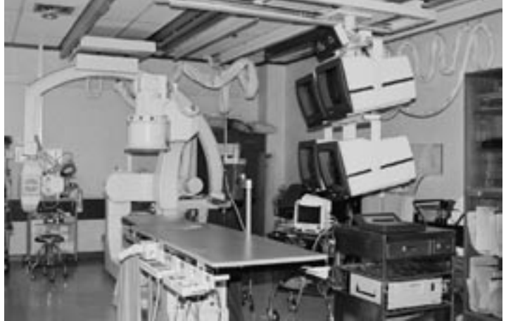
シリラート病院の循環器 X 線撮影装置

マヒドン大学医学部附属シリラート病院では先に調査を行った東北地方のコンケン大学医学部附属スリナカリン病院およびコンケン病院との格差を調査するために、放射線診断領域の放射線室の調査および担当者との面談を行った。シリラート病院はバンコク首都圏の大学附属病院であるため、放射線診療機器は最先端の機器が導入され、診療放射線技術は特に高度に発達していた。同病院では日本国にて技術研修を受けた診療放射線技師が活躍しており、新たな基礎的技術研修の必要性はないと言える。